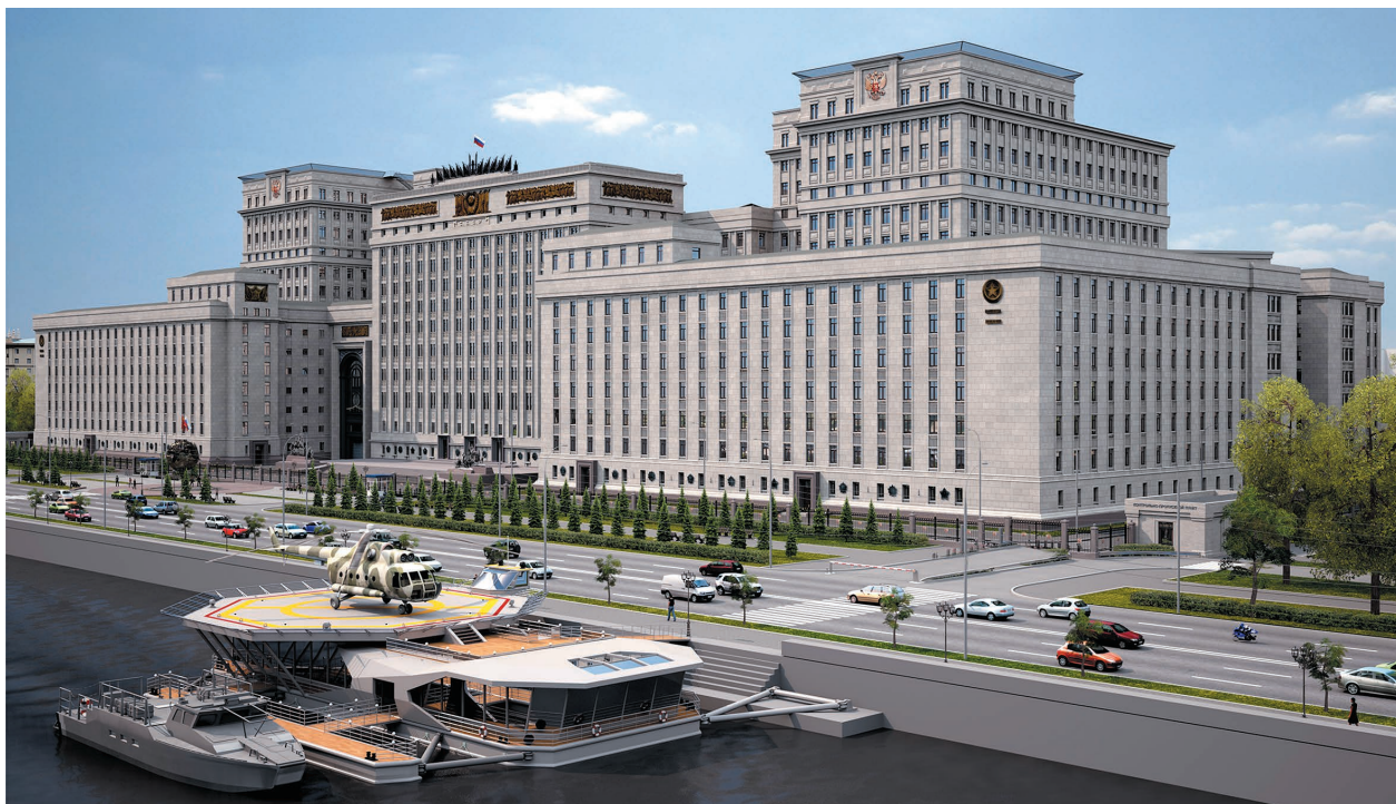
Министерство обороны Российской Федерации

Для функционирования созданной системы также необходимо заключить соглашения о взаимодействии с федеральными органами государственной власти.