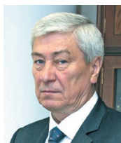
Председатель редакционного совета