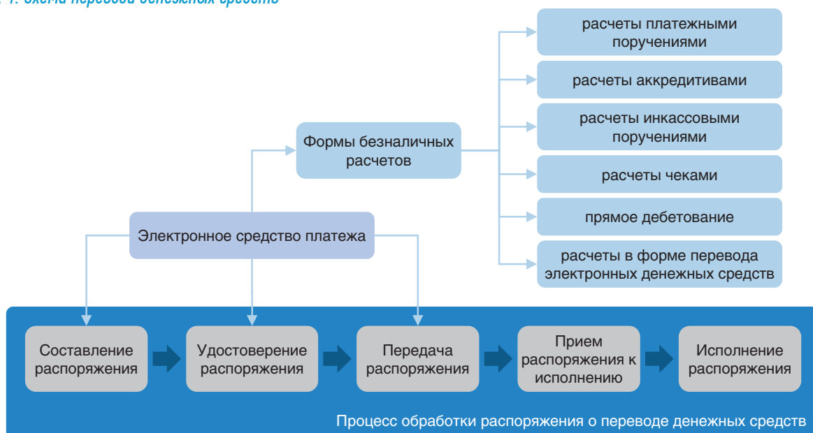
Рис. 1. Схема перевода денежных средств

Под электронным средством платежа Закон № 161-ФЗ понимает средство и (или) способ, позволяющие клиенту оператора по переводу денежных средств составлять, удостоверять и передавать распоряжения в целях осуществления перевода денежных средств (в рамках применяемых форм безналичных расчетов) с использованием информационно-коммуникационных технологий, электронных носителей информации,