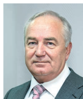
Заместитель председателя редакционного совета