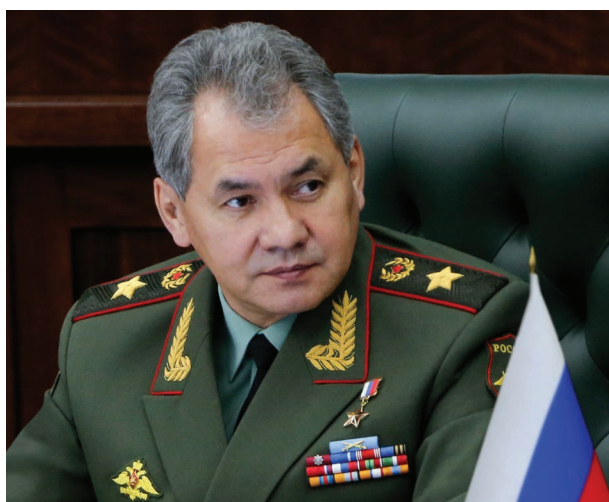
Сергей Кужугетович Шойгу

Сергей Кужугетович Шойгу, генерал армии, Министр обороны Российской Федерации